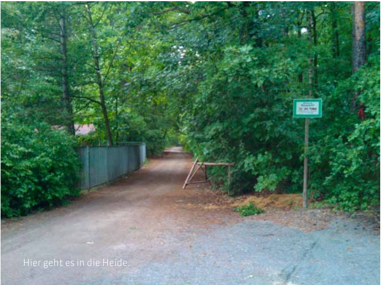
Hier geht es in die Heide.