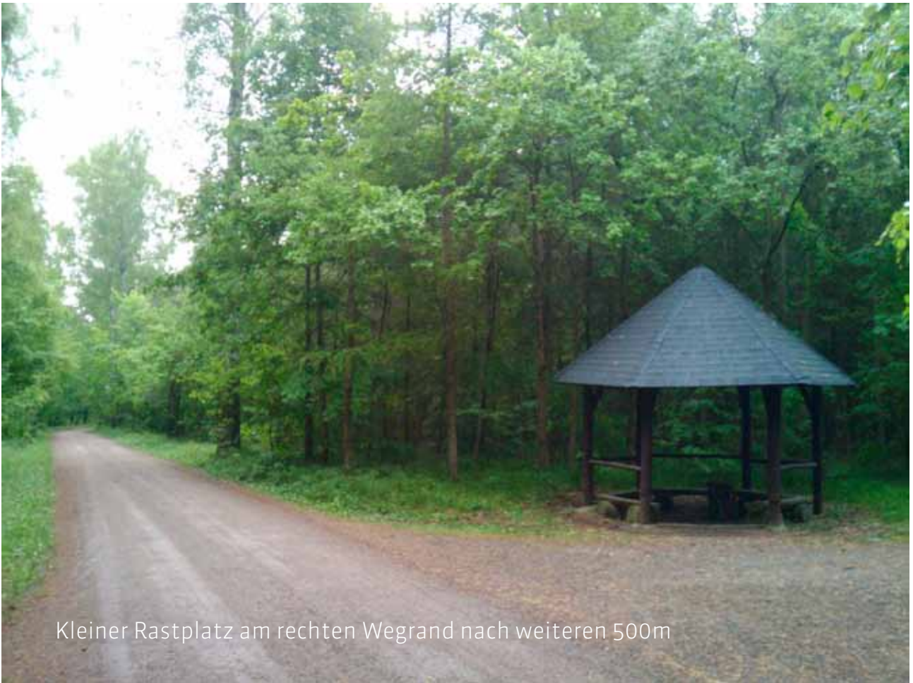
Kleiner Rastplatz am rechten Wegrand nach weiteren 500m