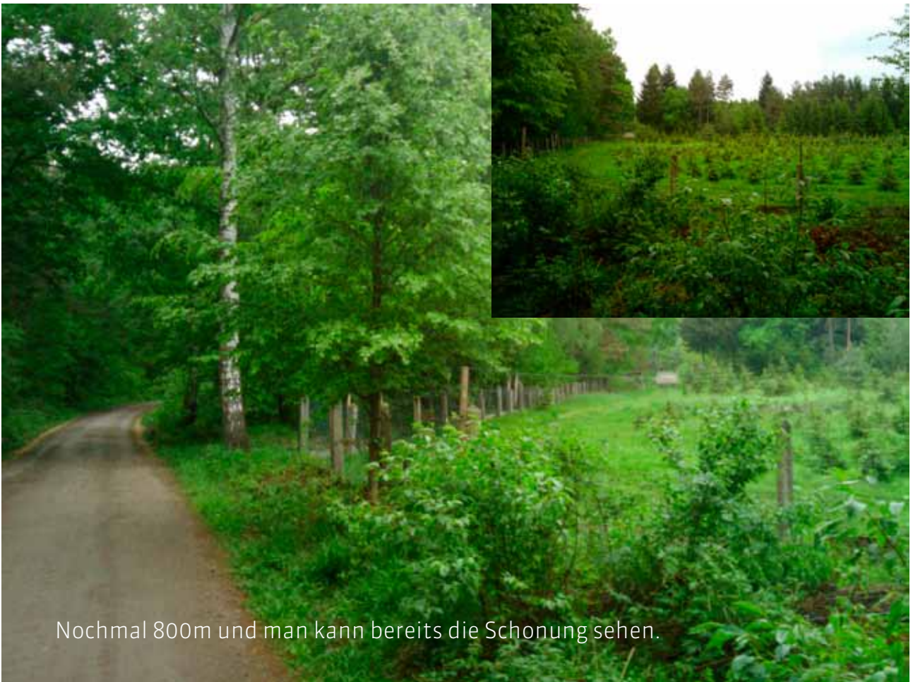
Nochmal 800m und man kann bereits die Schonung sehen.